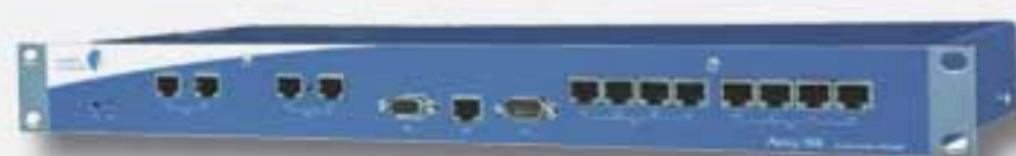
Parlay i60 til store og mellemstore virksomheder Flex ISDN eller ISDN 30 linier