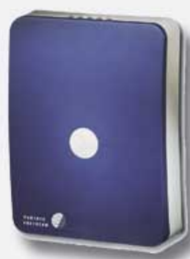
Parlay i8 til mindre virksomheder med ISDN2