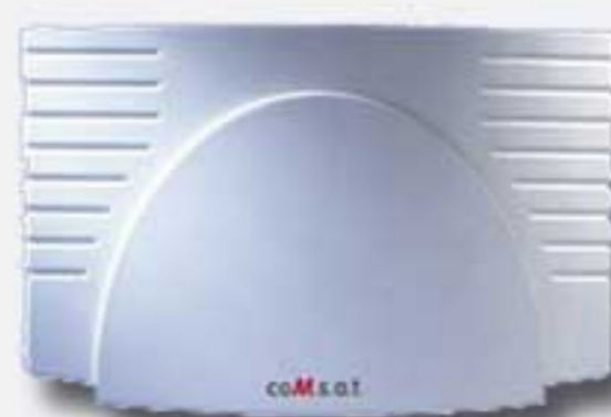
CoMsat - tysk kvalitet med masser af funktionalitet